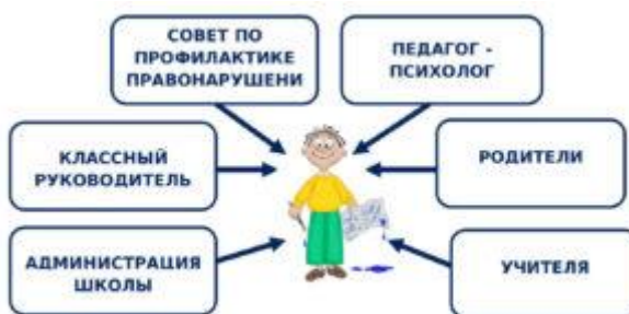
Схема сотрудничества участников воспитательного процесса по профилактике правонарушений, безнадзорности среди несовершеннолетних

Педагог-психолог, классные руководители и администрация школы осуществляют индивидуальную работу с детьми и родителями, посещают социально неблагополучные семьи и семьи группы риска, организуют встречи учащихся с сотрудниками правоохранительных органов, проводят тематические классные часы и беседы, осуществляют работу с подростками, состоящими на учете в КДН, ПДН, внутришкольном учете.