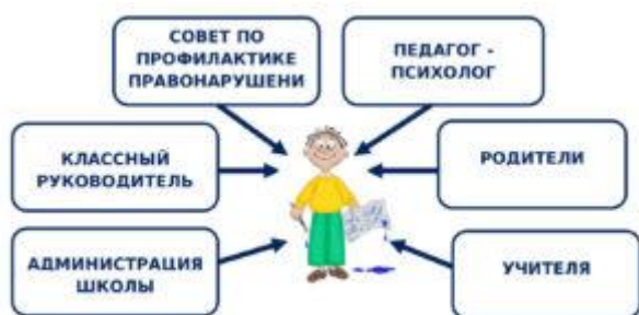
Схема сотрудничества участников воспитательного процесса по профилактике правонарушений, безнадзорности среди несовершеннолетних

Педагог-психолог, классные руководители и администрация школы осуществляют индивидуальную работу с детьми и родителями, посещают социально неблагополучные семьи и семьи группы риска, организуют встречи учащихся с сотрудниками правоохранительных органов, проводят тематические классные часы и беседы, осуществляют работу с подростками, состоящими на учете в КДН, ПДН, внутришкольном учете.